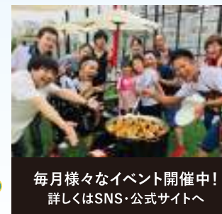
毎月様々なイベント開催中! 詳しくはSNS・公式サイトへ