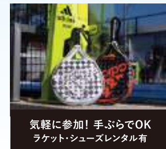
気軽に参加! 手ぶらでOK ラケット・シューズレンタル有